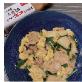
豚肉と長芋の 卵いため