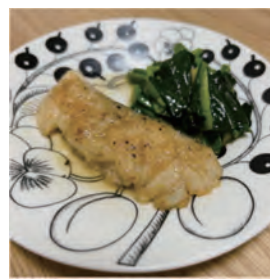
タラのムニエルと ほうれん草バター