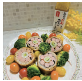
ソーセージの豚肉巻き