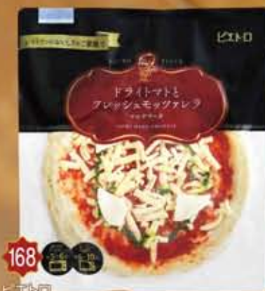
ドライトマトとフレッシュモッツアレラ / ベーコンとボサトのジューパーゼ / なすとひき肉の辛味スパゲティ

168 ピエトロ ドライトマトとフレッシュモッツアレラ 約200g 本体価格 850円 (参考税込価格) 918円 特定原材料: 乳成分 小麦