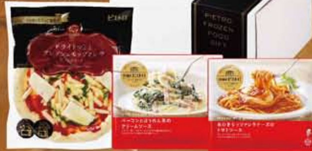
ドライトマトとフレッシュモッツアレラ / ベーコンとほうれん草のクリームソース / 糸ひきモンツァレラチーズのトマトソース

161 ピエトロ パーティーセット 3個入 約957g 本体価格 2,400円 (参考税込価格) 2,592円 特定原材料: 乳成分 小麦