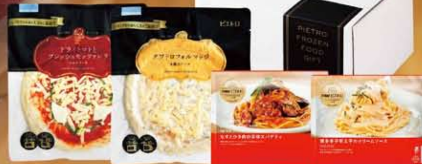
ドライトマトとフレッシュモッツアレラ / クワトロフォルマッジ / なすとひき肉の辛味スパゲティ / 博多幸子明太子のクリームソース

162 ピエトロ パーティーセット 4個入 約1100g 本体価格 3,000円 (参考税込価格) 3,240円 特定原材料: 乳成分 小麦